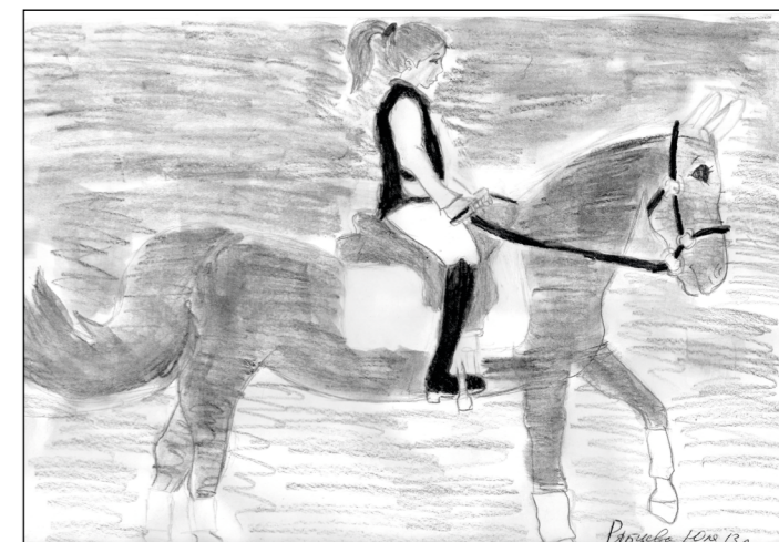
Рябцева Юлия, 13 лет